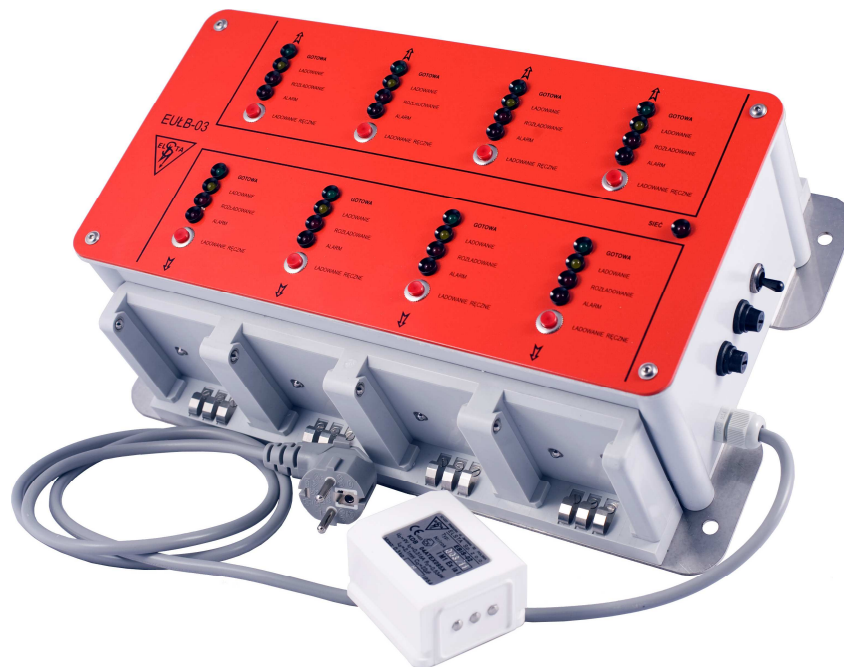
Widok urządzenia do ładowania baterii typu EUŁB-03