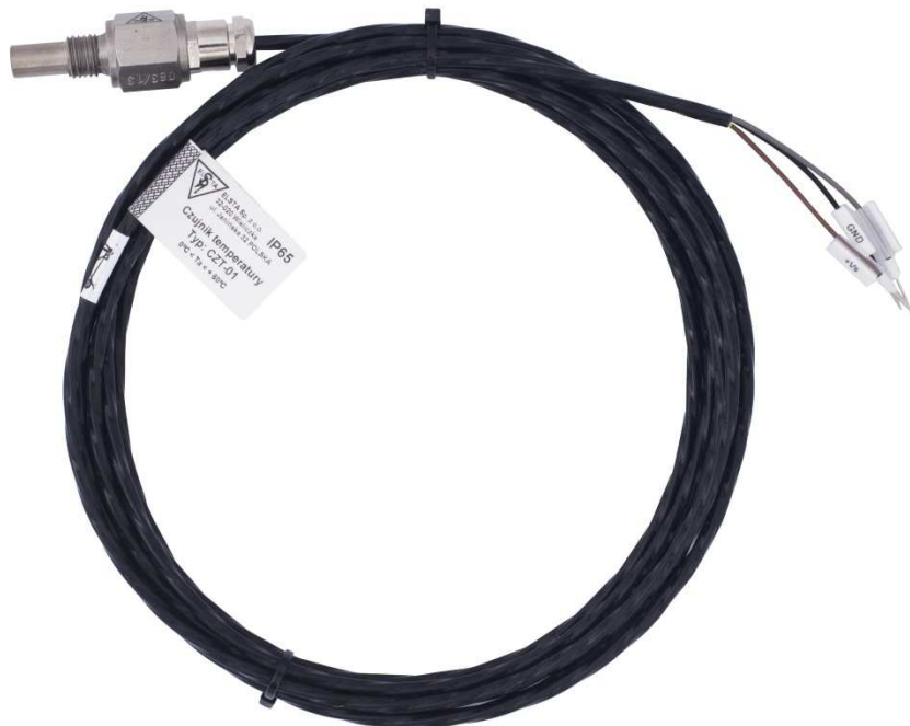
Widok czujnika temperatury typu CZT-01